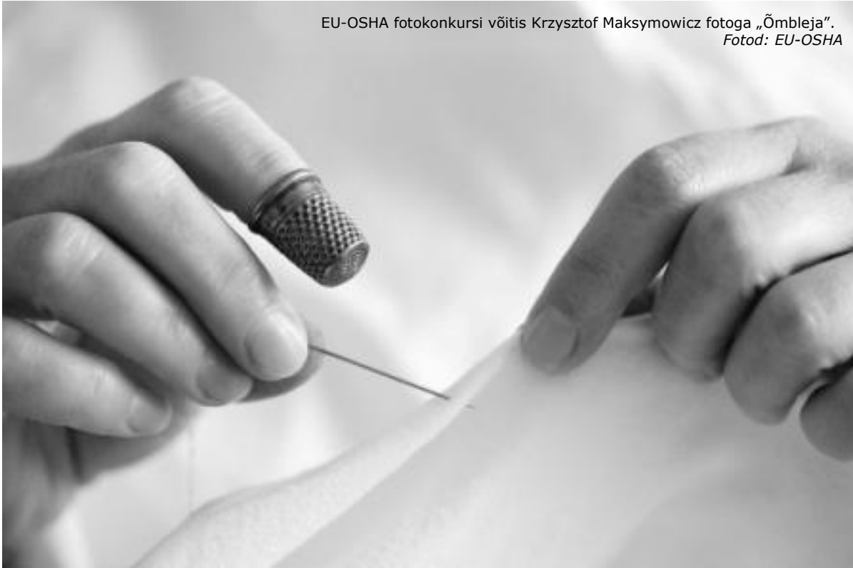
EU-OSHA fotokonkursi võitis Krzysztof Maksymowicz fotoga „Õmbleja”.