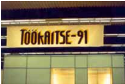
1991. aasta novembris toimus rahvusvaheline töökaitse näitus ja konverents „Töökaitse '91“.