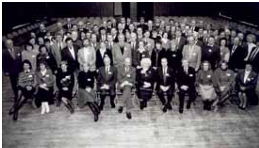
Esimesest Rootsi-Eesti töökeskkonnaalasest konverentsist osavõtjad Tallinna Ehitus- ja Mehaanikatehnikumi saalis.

7.–8. septembril 1993 toimus Tallinnas rahvusvaheline töökaitsekonverents ja näitus „75 aastat töökaitset Eestis“, millest võtsid osa Rahvusvahelise Tööorganisatsiooni (ILO) ning Rootsi, Soome, Norra, Taani, Islandi, Leedu ja Läti töökaitse juhtivametnikud, samuti Eesti selle ala juhtivteadurid ja spetsialistid. Konverentsi korraldajaid ja külalisi võttis Toompeal vastu peaminister Mart Laar.