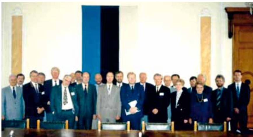
Rahvusvahelisest töökaitsekonverentsist osavõtjad peaminister Mart Laari (keskel) vastuvõtul Toompeal.

7.–8. septembril 1993 toimus Tallinnas rahvusvaheline töökaitsekonverents ja näitus „75 aastat töökaitset Eestis“, millest võtsid osa Rahvusvahelise Tööorganisatsiooni (ILO) ning Rootsi, Soome, Norra, Taani, Islandi, Leedu ja Läti töökaitse juhtivametnikud, samuti Eesti selle ala juhtivteadurid ja spetsialistid. Konverentsi korraldajaid ja külalisi võttis Toompeal vastu peaminister Mart Laar.