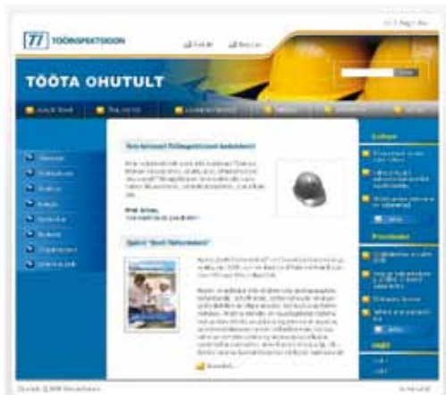
Tööinspektsiooni veebileht 2006. aastal.

Kodulehel leidis teavet töökeskkonna kujundamiseks ja ohutumaks muutmiseks nii tööandjale kui ka töotajale, samuti töökeskkonda ja töösuhteid käsitlevad seadused ja määrused, standardid, juhendmaterjalid, selgitused, kampaaniate tutvustused, töökeskkonda ja inspektorite tööd puudutav statistika alates 1997. aastast.