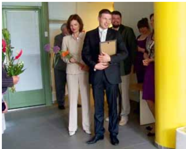
Sotsiaalminister Hanno Pevkur (keskel) on väisanud mitmeid Tööinspektsiooni üritusi.