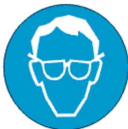
Kanna silmakaitse- vahendit

Positiivne tähelepanek oli see, et valdaval enamus töövahenditel on olemas tootjapoolt kleebitud informatsioon, mis viitab müratasemele (tavaliselt üle 104dB) ning ohumärk „kanna silmakaitsevahendit“ ja „kanna kuulmiskaitsevahendit“ .