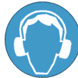
Kanna kuulmis- kaitsevahendit

Kahjuks kontrollide käigus tuvastas tööinspektor, et päris paljudes kontrollitud kohtades ei olnud töötajad teadlikud isikukaitsevahendite kasutamise vajalikkusest lehepuhuriga töötamisel. Samuti ei olnud nad teadlikud, mida tähendab puhuri peal näidatud müratase. Kõikidel kontrollitud lehepuhuritel jäi müratase määrgistus 104-106 dB-ni. Vestluse käigus selgus, et enamus töötajad, ei ole teadlikud, et müratasemest alates 85 dB tuleb kanda kuulmiskaitsevahendeid. Kontrollimise ajal oli vaja selgitada töötajatele, et isikukaitsevahendite mitte kandmine võib põhjustada mürakahjustusi ning selle teke sõltub heli tugevusest ja sagedusest, müras viibimise ajast ning individuaalsest tundlikkusest helile. Tugeva heli tagajärjel tekib sisekõrva ja kuulmisnärv kahjustus.