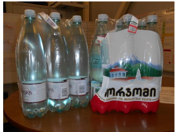
Бутылки с минеральной водой в ожидании раздачи работникам.

Кроме того, в производственном зале было установлено три логгера для измерения температуры и влажности воздуха. На основании их показаний можно определить, когда нужно раздавать работникам минеральную воду. Поскольку показатели сервера можно отследить, то при необходимости можно доказать обоснованность покупки воды и Налоговому департаменту.