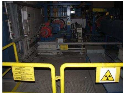
Обозначение опасной зоны. Надпись на табличке: "Опасная зона. Посторонним вход воспрещен".