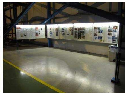
Визуализация различных проектов в сфере безопасности труда и информации для посетителей и работников.