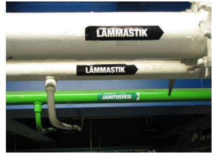
Обозначение труб (назначение труб).