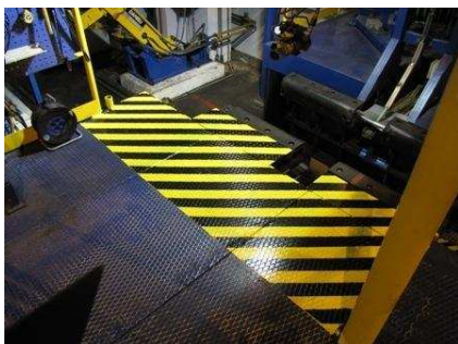
Обозначение края платформы. Работнику всегда хорошо видно, где заканчивается платформа (строительство ограждений невозможно в связи с характером данной рабочей процедуры).

Улучшилось как состояние подъемников, так и общее впечатление о заводе, поскольку никто больше не наезжает на конструкции. Передвижение посетителей, субподрядчиков и собственных работников предприятия по заводу стало более организованным и безопасным, поскольку реже происходит отклонение от зеленых путей движения, и таким образом снизились риски, связанные с "гуляющими" в производственной зоне лицами.