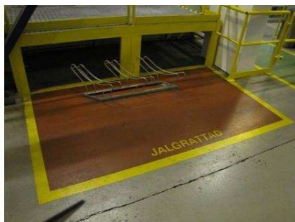
Образец стационарной зоны складирования (велосипеды). На заводе много передвигаются на велосипедах.