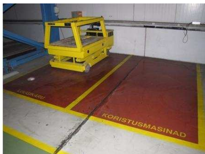
Образец зоны складирования (машины для уборки и тележка для перемещения дверей гальванической печи).