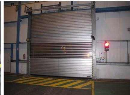
Светофоры на дверях склада визуализируют возможности проезда.