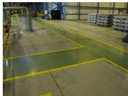
Обозначение безопасной пешеходной дорожки в производственной зоне.