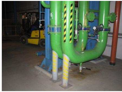
Обозначение труб (для водителей подъемника и мостового крана).