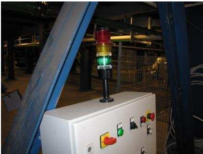
Образец мигалки. Различные мигалки используются для визуализации рабочего режима оборудования.