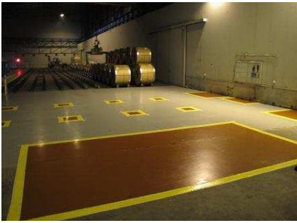
Образец зоны складирования (склад сырья - распаковка).