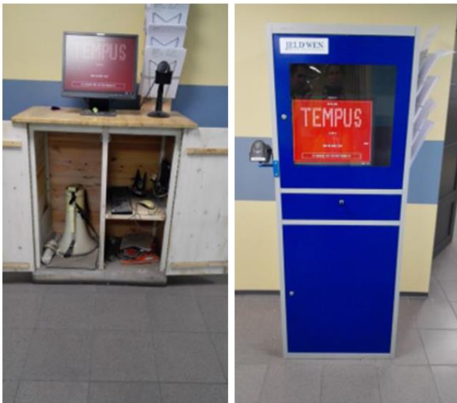
Joonis 2 SIO näiteid (enne ja pärast)