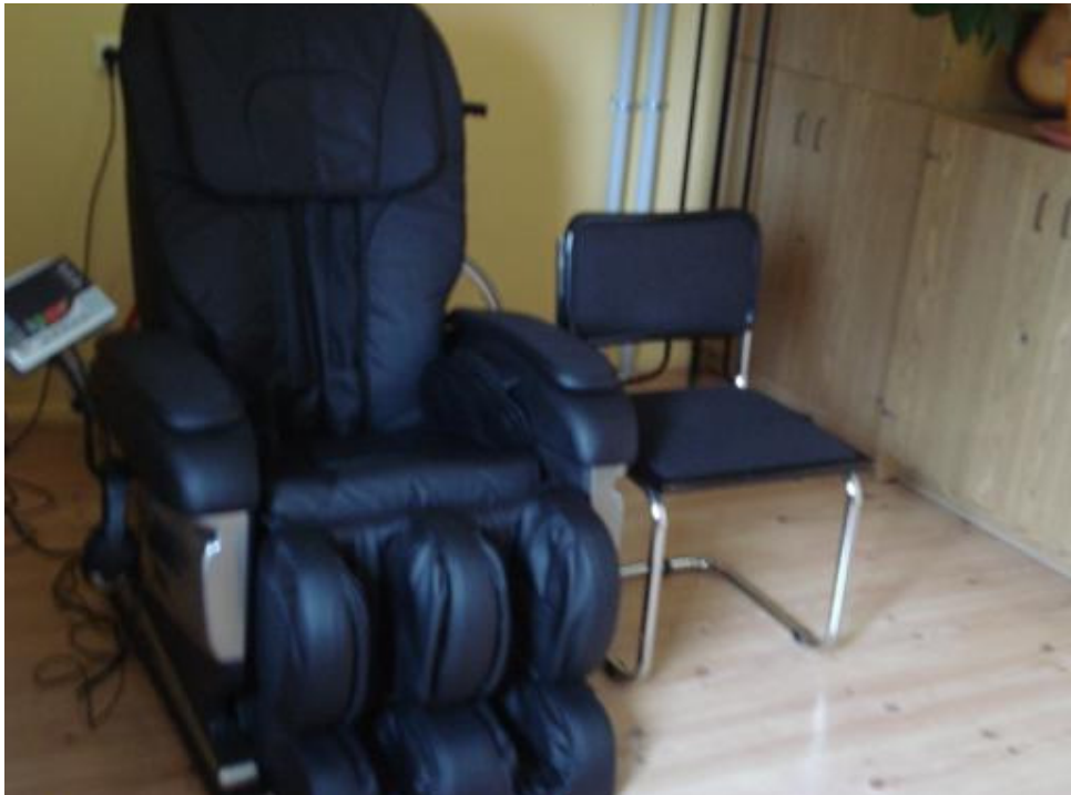
Massaažitool aitab töötajatel lõõgastuda.

Massaaživõimaluse tagamisega paraneb nii töötajate vaimne kui ka füüsiline toonus.