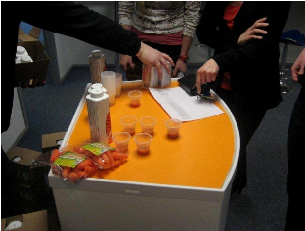
Tervisenädala raames pakuti töötajatele Kadarbiku talu mahlu.

Tervislike eluviiside soodustamiseks otsustasime hakata korraldama tervisenädalat.