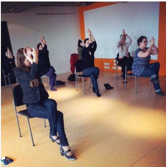
Töötajad tegid ühiselt joogat ning võistlesid sportmängudes.

Ka pärast tervisenädalat külastab massöör regulaarselt kontorit, pakkudes meie ruumides soovijaile massaaži.