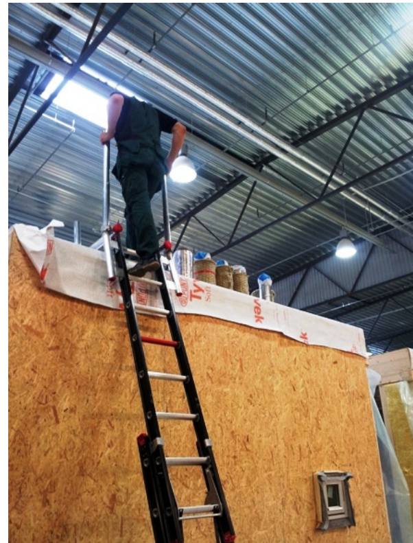
Redelit on võimalik kindlat kinnitada ruumelemendi katusepinnale.