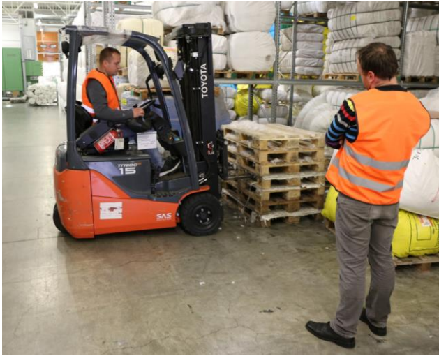
Pilt 2. Praktiline osa - aluste ladustamine