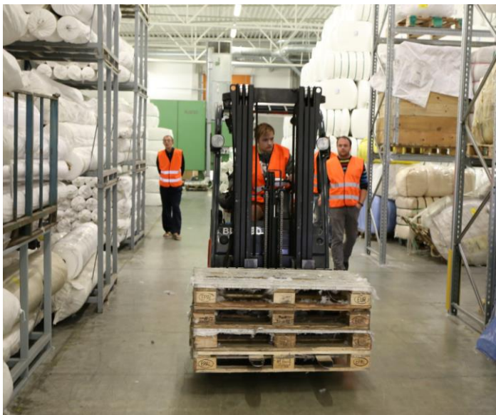
Pilt 1. Praktiline osa

Ettevõttesiseselt on koolitatud kokku üle 40 tõstukijuhti, mille tulemusena on ettevõtte hoidnud kokku 7 kuuga ~6000 eurot (võttes arvesse, et varasemalt oli ühe töötaja koolituse maksumus ligikaudu 150 eurot) ja seda kõike mitte ohutuse arvelt, vaid panustades sisekoolituse läbiviimisesse. Lisaks oleme koolitanud ka neid töötajaid, kelle igapäevane töö ei nõua tõstukiga töötamist, kuid vastav oskus võimaldab teatud tööoperatsioonides vähendada raskuste käsitsi teisaldamist. Järjepidev ja süsteemne töötajate koolitamine on üks olulisi eeldusi ohutuma ja töötajasõbralikuma töökeskkonna loomisel ja parendamisel.