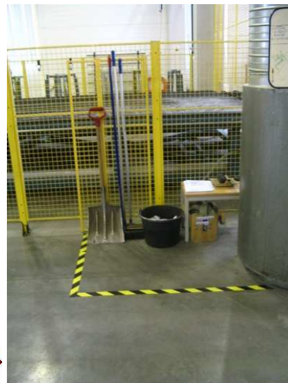
Töökoht enne ja pärast 5S põhimõtetel korrastamist.