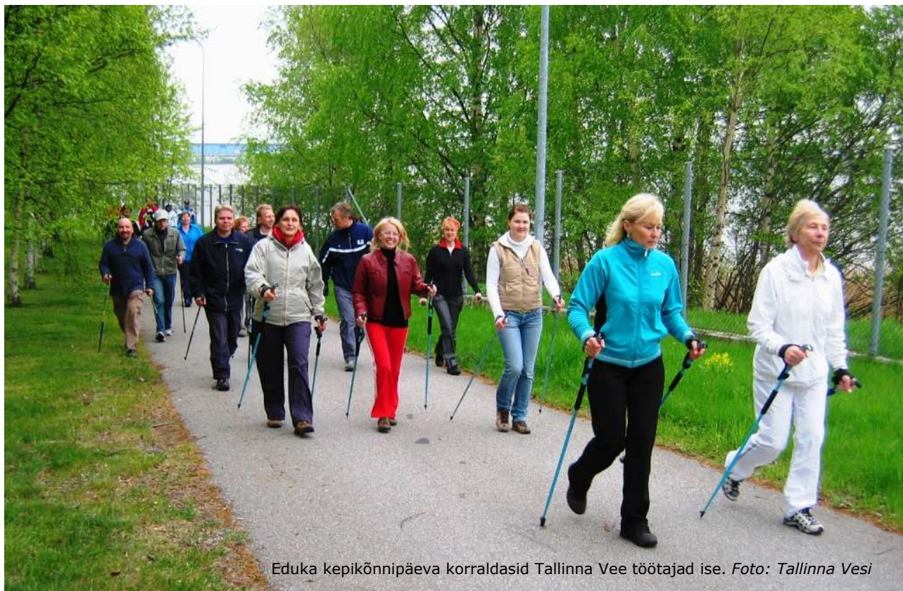
Eduka kepikõnnipäeva korraldasid Tallinna Vee töötajad ise.

Seda, et Tallinna Vesi mõtleb oma töötajatele, näitavad iga-aastaselt korraldatavad pühendumusuuringud. Selle aasta andmete kohaselt on töötajate pühendumus võrreldes 2008. aastaga oluliselt tõusnud ning ületab märgatavalt kõiki Eesti keskmisi võrdlusnäitajaid. Eriti rõhutab Voogla seejuures fakti, et pühendumus tõusis kõigis üksustes: „Paar aastat tagasi läksid inimesed ära, sest ehitussektor pakkus kordades kõrgemat palka. Nüüd hinnatakse seda, et tegu on stabiilse ettevõttega. Oluline on aga, et pühendumus tõusis kõigis osakondades, sealhulgas ka näiteks IT-osakonnas, kus tööjõuturul on alati nõudlus ja võimalus minna mujale.“