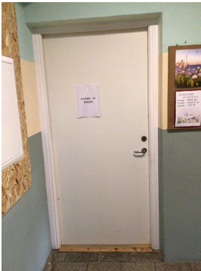
Joonis 2. Sissepääs tsooni, kus viibisid nakatunud kliendid.

28,57% hooldekodudest polnud tööandja asjakohaste ohutusmärkidega märgistanud ohualad, kus on kohustuslik kasutada isikukaitsevahendit. Näiteks puudus maski kandmist kohustav märk hooldekodu sissepääsu juures. Viiruskolletega hooldekodude puhul puudusid nakatunud tsooni sisenemisel kohustusmärgid kaitseriietuse, -mütsi, -kinnaste, -visiiri ja -jalanõude kasutamise kohta. Nt osakonna uksele võis küll näha silti „Covid-19 tsoon“, kuid vajalike isikukaitsevahendite kasutamisele polnud kohustusmärkide abil tähelepanu juhitud.